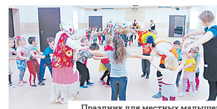
Праздник для местных малышей