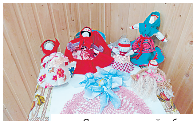
Сувениры ручной работы