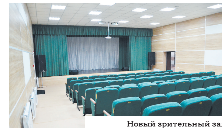
Новый зрительный зал