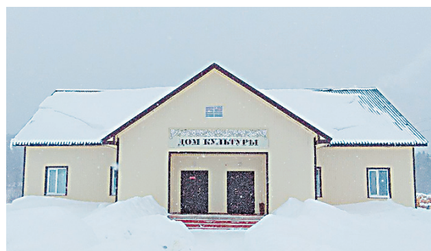
Здание ДК Студенец