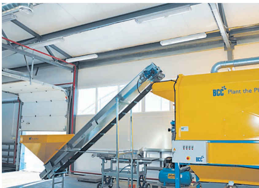
Оборудование для посадки семян