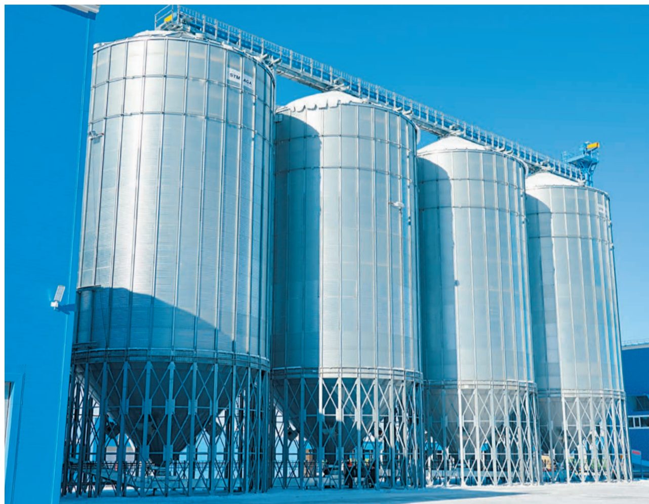
Силосы готовой продукции