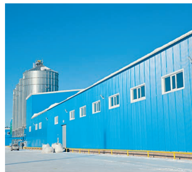
Склад готовой продукции