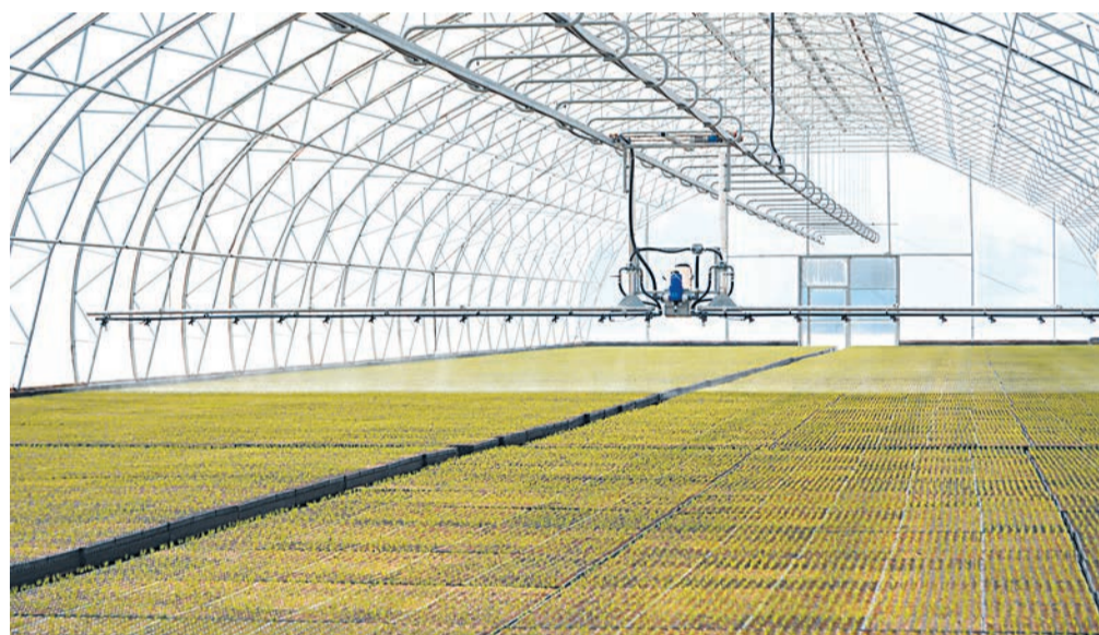
Система полива в теплицах