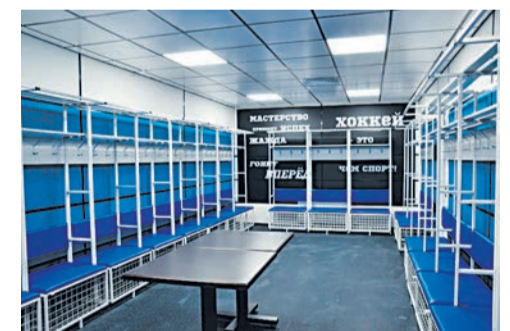
Раздевалка для хоккеистов