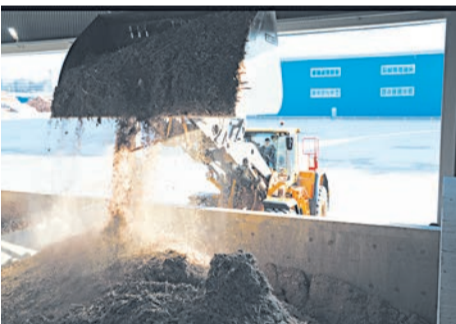
Подача топлива в котельную