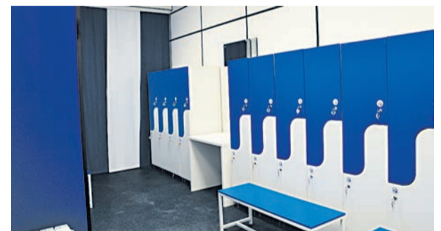
Раздевалка для сухих тренировок