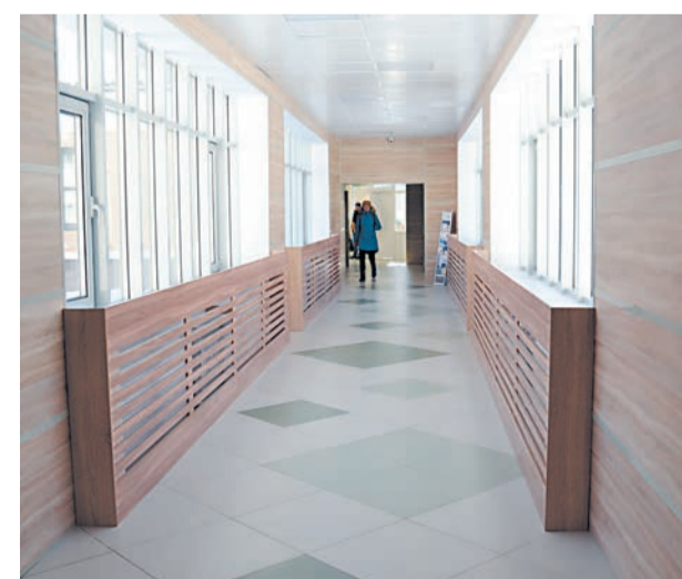
Переход в здание ЦРБ