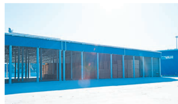
Навес для сухих пиломатериалов