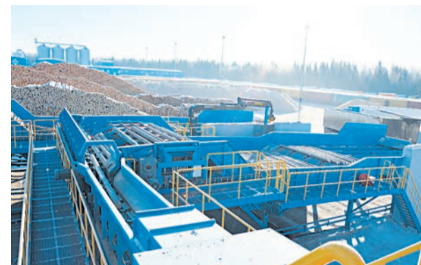
Подача пиловочника в лесопильный цех