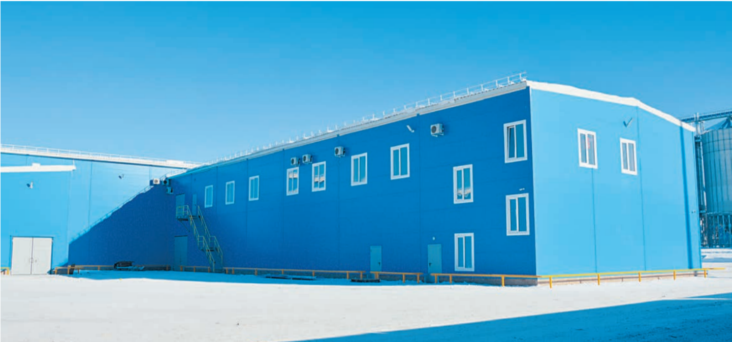
Цех сортировки сухих пиломатериалов