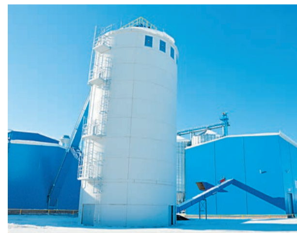
Силос для сухого сырья