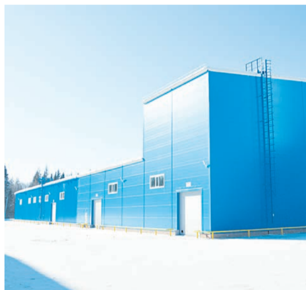
Цех упаковки готовой продукции