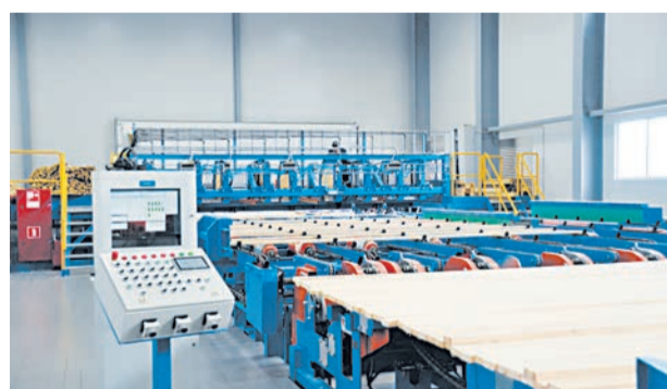
Линия сортировки сырых пиломатериалов