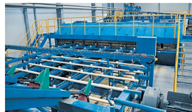
Линия сортировки сырых пиломатериалов