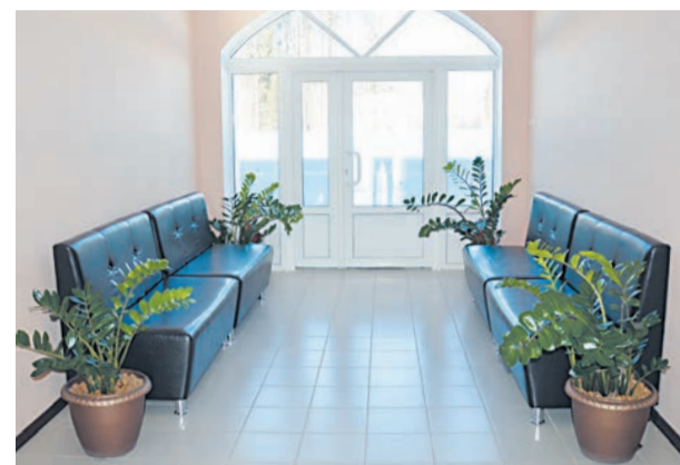
Офис семеноводческого комплекса