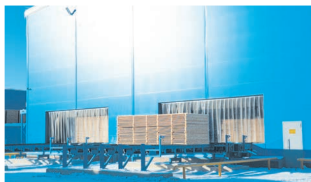
Выход готовой продукции из цеха