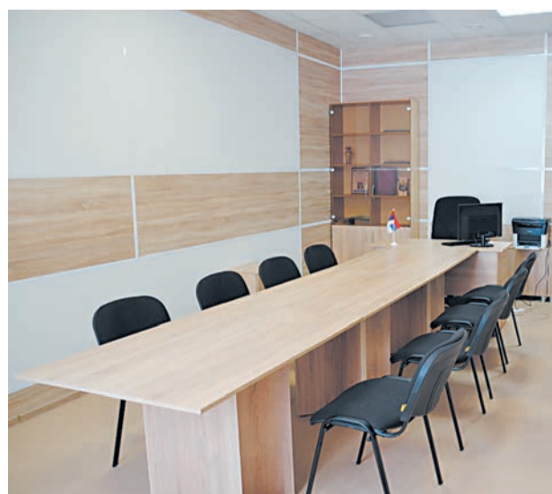
Кабинет Совета села