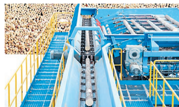
Подача пиловочника в лесопильный цех