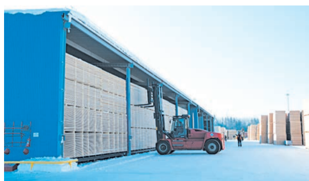
Загрузка в сушильные туннели