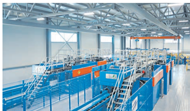
Две линии распиловки