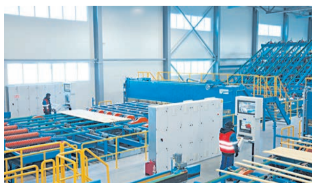
Оборудование лесопильного цеха