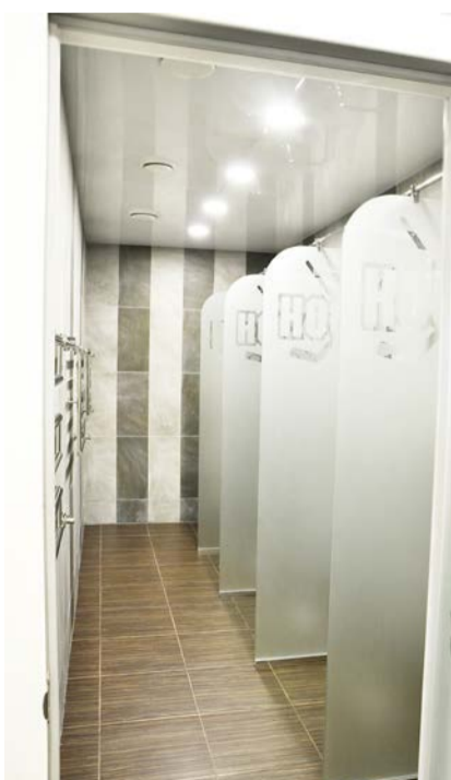
Душевые в раздевалках