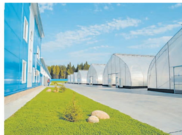
Теплицы для выращивания сеянцев