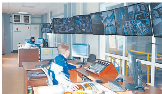
Операторы лесопильной линии