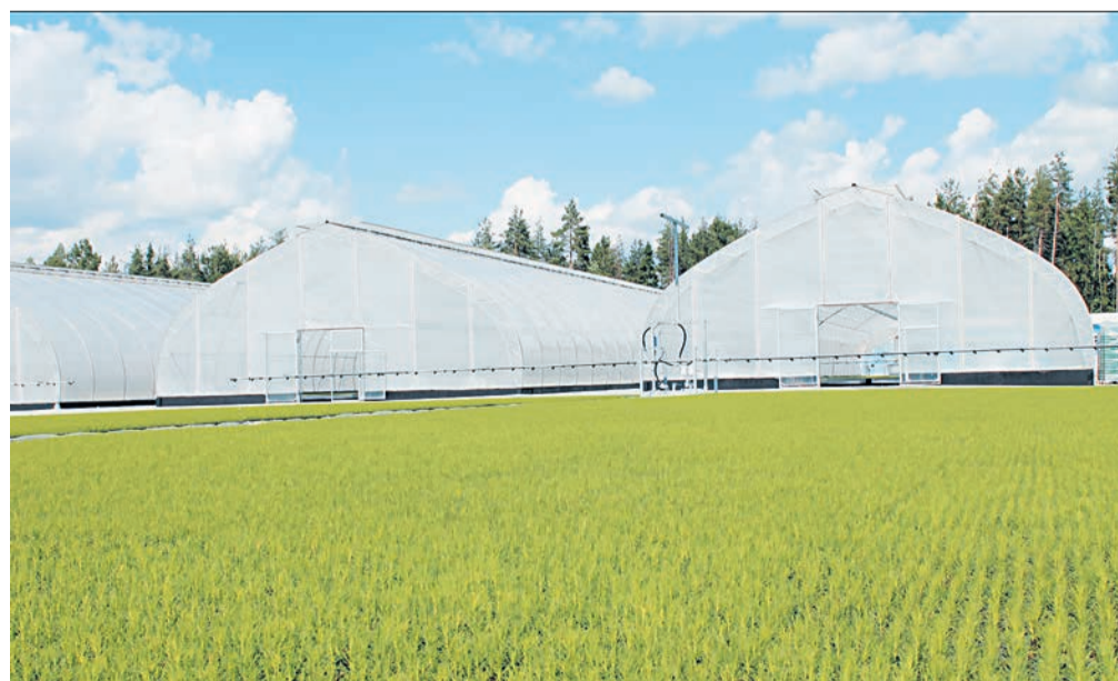
Сеянцы на площадках закаливания