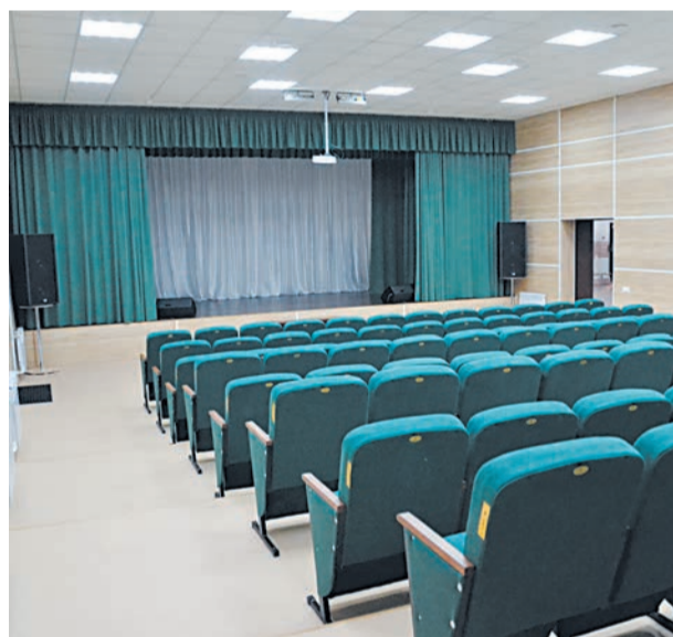
Новый зрительный зал