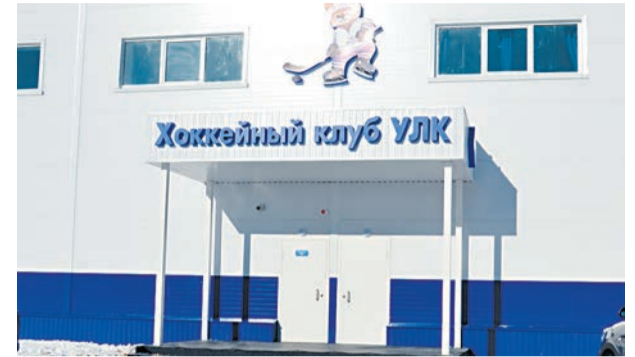
Центральный вход в Ледовый дворец