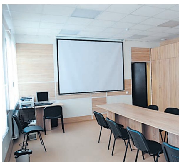
Кабинет Совета ветеранов