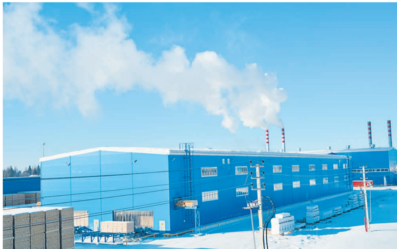
Новый лесопильный цех